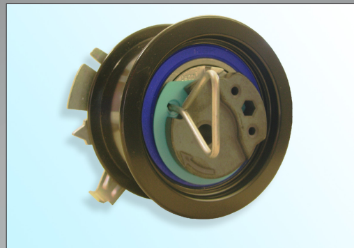
Рис. 1: 55739 (старая модель)

При монтаже новой модели следите за тем, чтобы не была повреждена поверхность натяжного ролика!